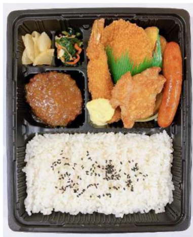
① 洋風バラエティ弁当 720円