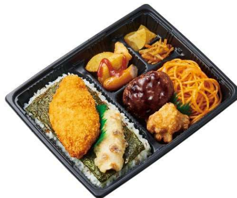
② スポーツ弁当 のり 670円