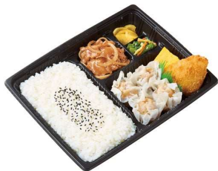
③ スポーツ弁当 しょうが焼き&焼売 700円