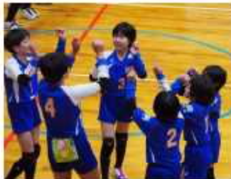
写真パネル (イメージ)