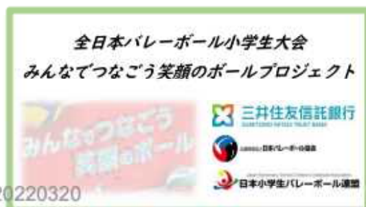
コメント用パネル (イメージ)