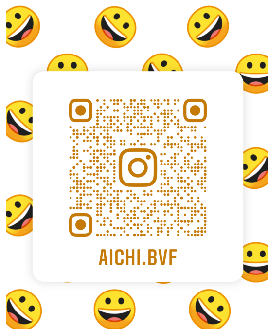
愛知県ビーチバレーボール連盟 (Instagram)