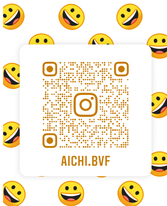
愛知県ビーチバレーボール連盟(Instagram)